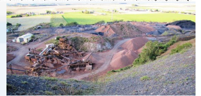
Certains terrils sont exploités, ici, un site de production de 'cailloux rouges' que l'on retrouve sur les trottoirs et allées un peu partout.